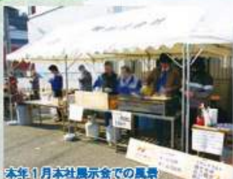
本年1月本社展示会での風景

あたたかかった当日は、大勢のお客様にご来場いただきました。お客様に飲食コーナーを実施し、あたたかいおもてなしを行い飲食コーナーでの売り上げのすべてを義援金としました。